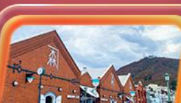
โถงอิฐแดง

สายการบิน Thai Airways (TG) น้ำหนักกระเป๋า 23 KG